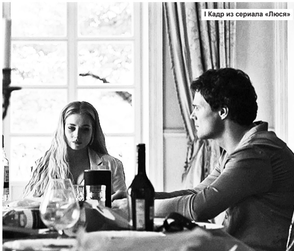
Кадр из сериала «Люся»